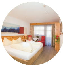
ZIRBE 22m² | 2 - 3 Personen