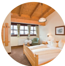
NEDERKOGL TYP B 26m² | 2 Personen