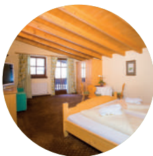
NEDERKOGL TYP A 33m² | 2 - 4 Personen