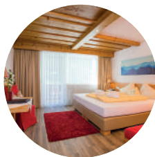
FICHTE 26m² | 2 - 3 Personen