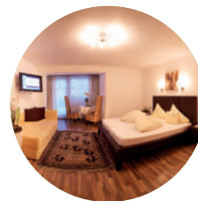
BRUNNENKOGL 43m² | 2 - 4 Personen