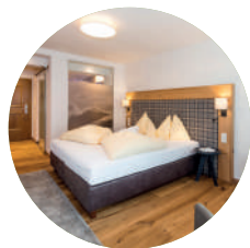
EICHE 22m² | 2 Personen