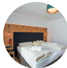
HUBERTUS 28m² | 2 - 3 Personen